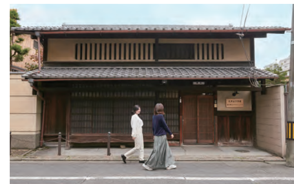
富小路町屋校园 富小路まちやキャンパス

また、本学には「富小路まちやキャンパス」があり、授業やイベントで京都文化が体験できます。京都の商店街や観光協会などとの連携プロジェクトも充実しています。